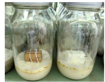
腐朽試験 (京大大学生存圏研究所)