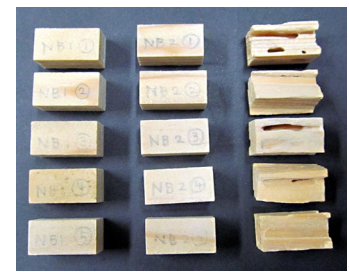
防蟻試験 (京大大学生存圏研究所)

JIS K 1571-2010 附属書 A (規定) 「木材保存剤の性能試験方法及び性能基準」