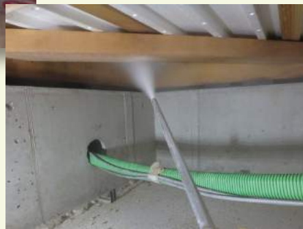
▼床下へのホウ酸ダスティング処理の様子