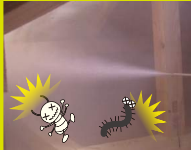
ホウ酸の粉を散粉