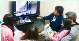
テレビモニターで 床下の状況報告