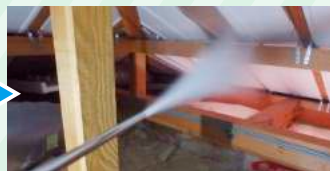
ホウ酸ダスティング 処理工事