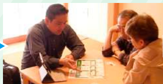
調査報告、工事の方針 をご説明