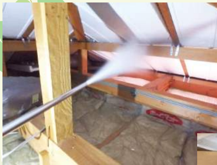
◀小屋裏へのホウ酸ダスティング処理の様子