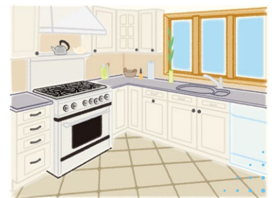
キッチン周りの除菌・防臭・防カビに。

カバンの中に一つ、オフィス・車の中・勉強部屋などの各お部屋、イベント等の景品、ちょっとしたプレゼント、お試用に。小さいボトルに「ホウ酸のチカラ」がたくさん詰まっています。通常のサイズとは携行用などでお使い分けいただけます。ますます身近にボレイトハウスキーパー™、是非お試しください。