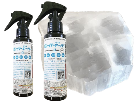
原料に自然素材を採用。ホウ酸塩鉱物。

※2 完全な防災・耐火の機能を提供するものではありません。火の元には十分ご注意ください。